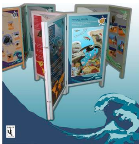
12 panneaux d'exposition ludiques et interactifs !